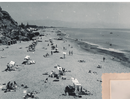
Playa del Bajondillo en los años 60, previo al boom inmobiliario

En el Pasaje Begoña se instalaron los primeros bares de España de ambiente homosexual, junto a otros locales de música, baile y diversión, convirtiéndose, de este modo, en todo un ejemplo de convivencia y respeto a la diversidad. A pesar de la represión que ejercía en España la dictadura de Franco, diversos factores como la entrada de divisas que propiciaba el turismo, así como y el deseo de proyectar al mundo una imagen de modernidad, hicieron posible que Torremolinos alcanzase fama internacional como destino turístico LGTBI durante la década de los 60 y que el Pasaje Begoña llegase a ser “una auténtica isla de libertad”.